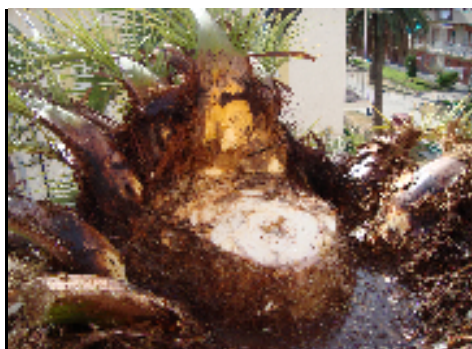
Cirugía recién hecha

En ocasiones, si la palmera está muy afectada, conviene realizar antes de cualquiera de los tratamientos lo que llamamos una cirugía , es decir, eliminar todo el tejido afectado de la palmera, como se observa en la primera imagen: